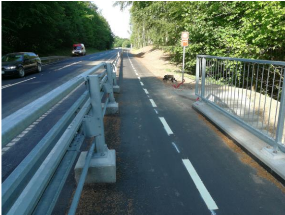
Dobbeltrettet cykelsti ved nedgang til Willestrup å