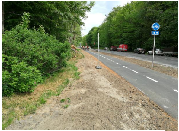
Indvielse af cykelsti. De først cyklister er på vej