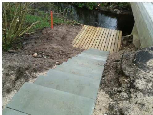
Nedgang til Willestrup å