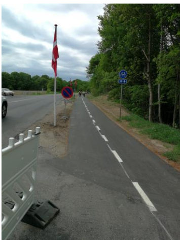
Indvielse af cykelsti. De først cyklister er på vej

Herunder etablering af sideudvidelse/sideflytning af Ardenvej ved Willestrup å, samt udskiftning og forlængelse af eksisterende autoværn.