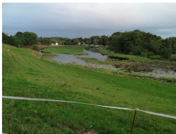
Nyt omløbsstryg etableret på nordsiden (til højre) efter dæmning er lavet inde i den eksisterende sø