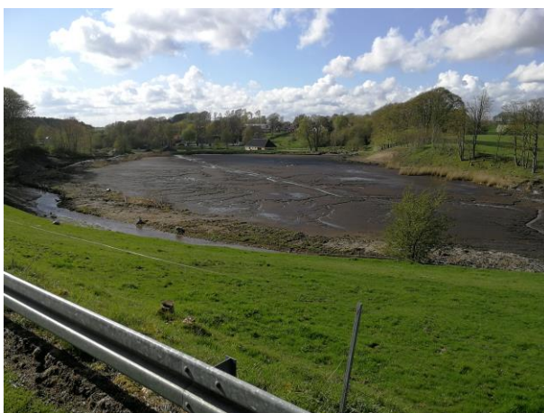
Etablering af midlertidig omløbsstryg syd for Døstrup Møllesø, efter søen er blevet tømt for vand

Søen bevares, og da det ikke var muligt at lave et omløbsstryg uden om søen, er der i stedet etableret en dæmning langs søens nordside således, at der kunne etableres et nyt omløbsstryg, i en del af den eksisterende sø.