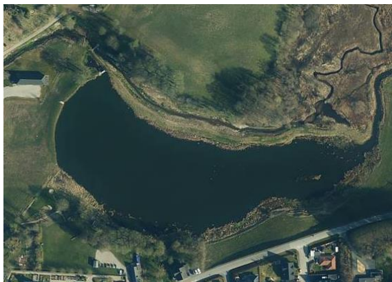
Døstrup Møllesø som den flot tager sig ud i dag. Omløbsstryg og dæmning ses på søens nordside