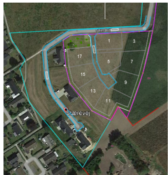
Placering af parceller i udstykning etape 2